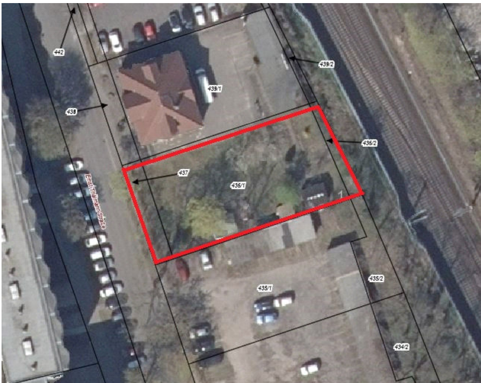
Luftbild I